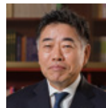
土屋 恵一郎氏 明治大学 学長